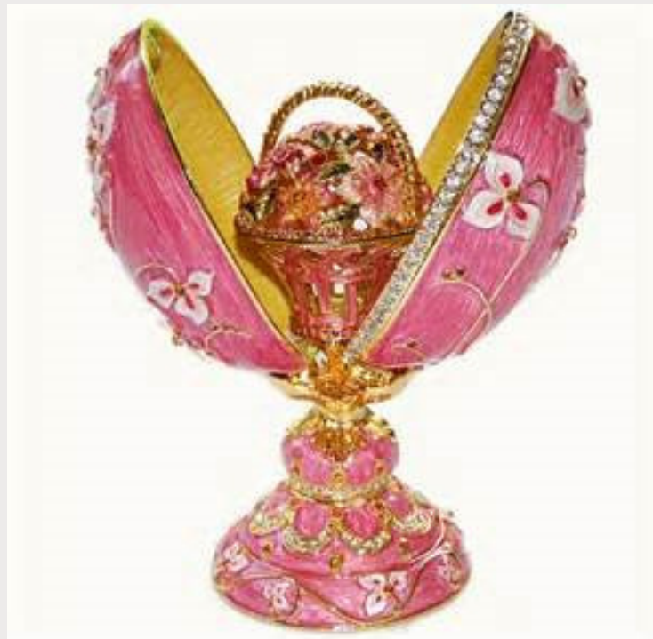
Fleurs de Printemps Grand œuf Fabergé

The Lenox Building 3399 Peachtree Road NE Suite 500 Atlanta GA 30326